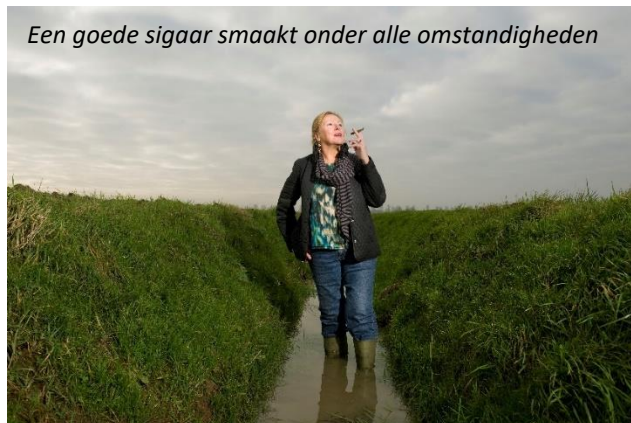
Een goede sigaar smaakt onder alle omstandigheden