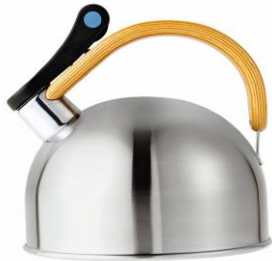
De designfluitketel Le Lapin