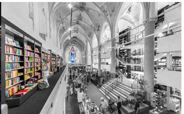
Restaurant in het Kruisherkerk Boekenzaak in de Dominicanenkerk Maastricht