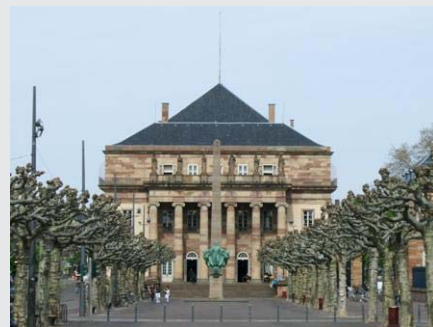
Buitenkant van het Operagebouw op de place Broglie in Straatsburg

http://www.operationaldurhin.eu/oper-2013-2014—rigoletto.html