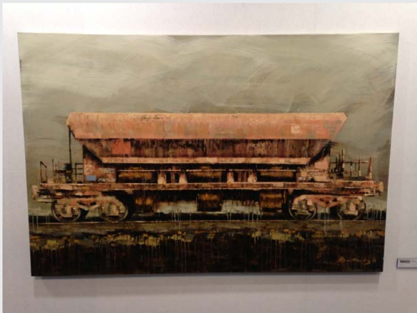
Patrick Bastardoz, Wagon, Olieverf