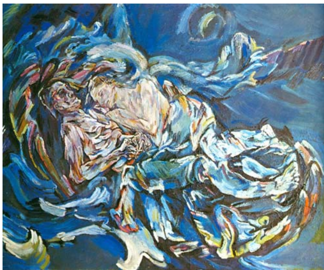
Oskar Kokoschka Bride of the Wind